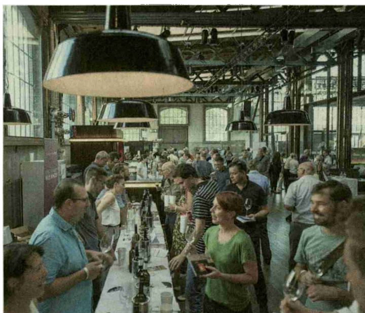
Die grosse Schweizer Weinausstellung im Zürcher Schiffbau ist mit der S-Bahn, dem Tram oder Bussen bequem erreichbar.

Der Sonntag, 26. August, 14 bis 18 Uhr, beginnt mit dem Festival «Grosse Weine aus der Schweiz und Österreich». So kam es zu dieser Vorpremiere: In 2008, vor der zusammen mit Österreich organisierten Fussball-EM, luden österreichische Winzer einige ihrer Schweizer Kollegen zur gemeinsamen Weinpräsentation ein. Diese ging als Weinländerspiel Österreich : Schweiz in die Geschichte ein. Erst als Mémoire & Friends, heute als Swiss Wine Tasting,