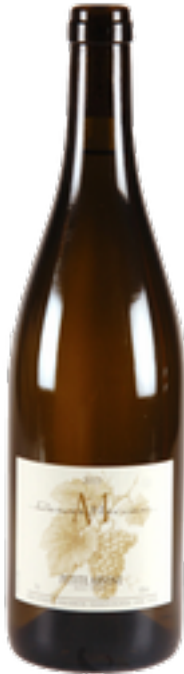
Petite Arvine 2018, für 26 Franken, erhältlich über Mercier Vins .