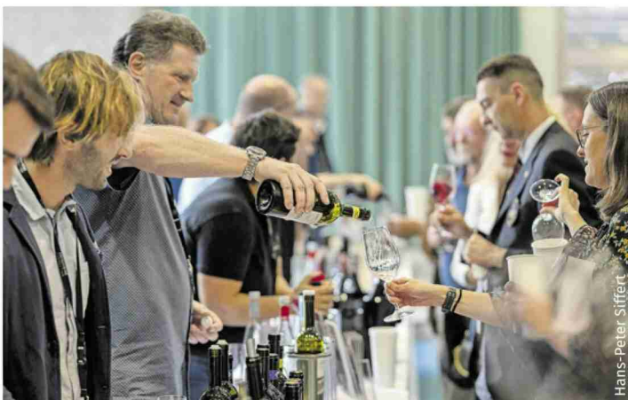
Swiss Wine Connection arrive à réunir un public nombreux.