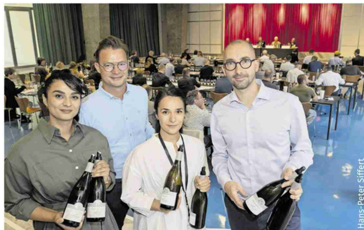
Quatre sommeliers provenant de Zurich et des Grisons réunis autour de millésimes exquis de Completer de Donatsch, comme 2010 et 2011.