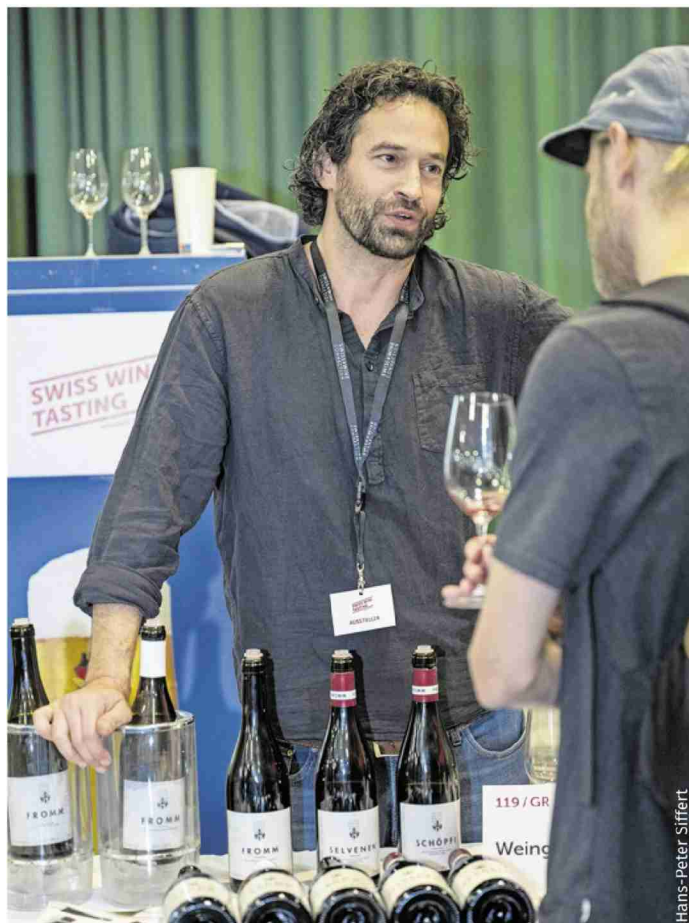
Les vigneron grisons Fromm se distinguent avec leurs grands Pinots Noirs encore superbement fruités sur le millésime 2013.