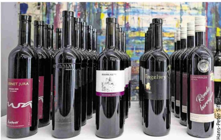
Un atelier présentait les cépages résistants et les vins PIWI.